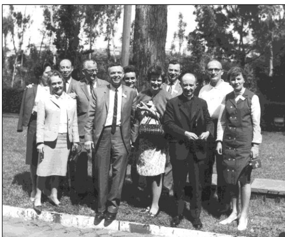
Uma equipe de Nossa Senhora, durante uma sessão de estudo em 1965